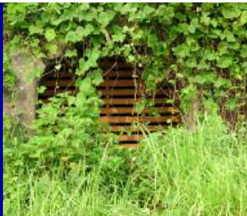
平馬場，道路脇に避難壕跡点在。