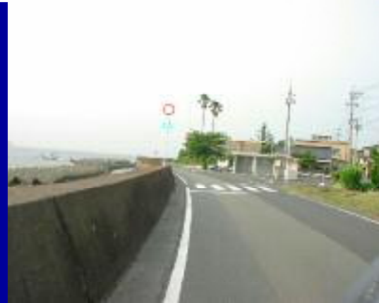
武公民館～学校へ，道路が狭く危険！