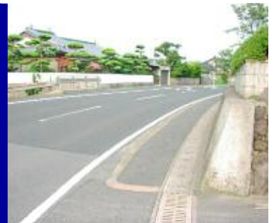
あみだ場付近，見通しの悪いカーブ！