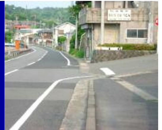
西白浜バス停付近，歩道が設置されていません