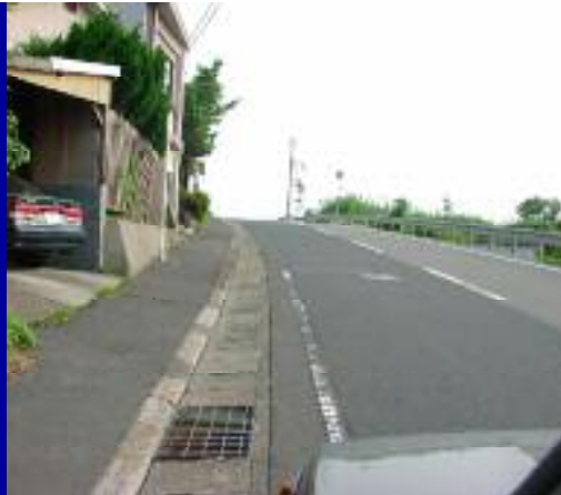
長谷橋付近，急な上り坂車道へはみだす生徒多し