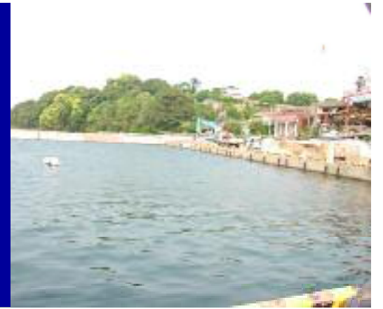
現在工事中，遊泳禁止区域内です