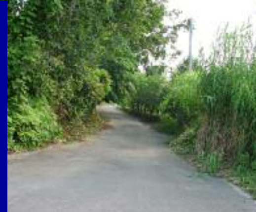
初崎の旧道です。周囲に街灯もなく死角になりやすい場所です。不審車情報有り！