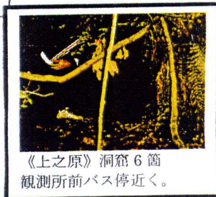
《上之原》洞窟 6 箇 観測所前バス停近く。