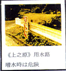
《上之原》用水路 増水時は危険