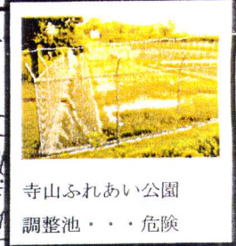
寺山ふれあい公園 調整池・・・危険