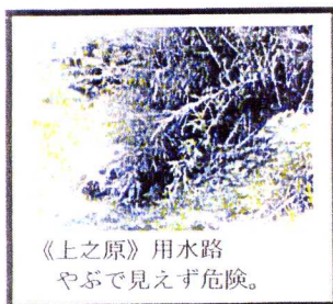
《上之原》用水路 やぶで見えず危険。