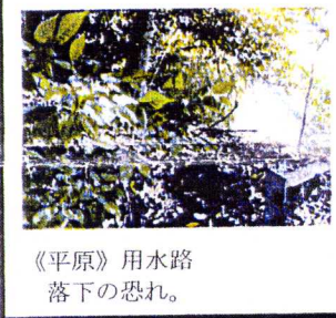
《平原》用水路 落下の恐れ。