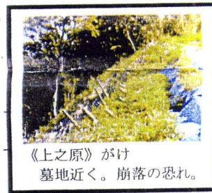
《上之原》がけ 墓地近く。崩落の恐れ。