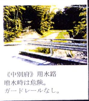
《中別府》用水路 増水時は危険。 ガードレールなし。