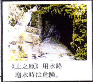
《上之原》用水路 増水時は危険。