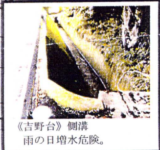
《吉野台》側溝 雨の日増水危険。