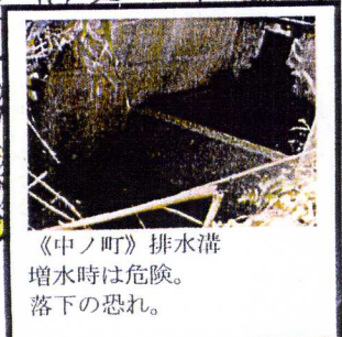
《中ノ町》排水溝 増水時は危険。 落下の恐れ。