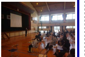
[入学児童保護者説明会]

来年度、荒田小学校入学予定の児童数は68人(2月20日現在)です。新入生の入学を荒田小一同心待ちにしています。