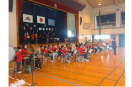
[♪かなでコンサート♪]

子供たちの素晴らしい演奏が、体育館内に響き渡り、会場からは大きな拍手が贈られ、とても素敵なコンサートとなりました。