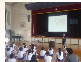
【都道府県応援団の説明】

1972年の「太陽国体」以来、51年ぶりに鹿児島で開催される国体の競技を観戦したり、都道府県応援団として参加したりすることは、スポーツへの関心を高め、心身の健全な発達やスポーツに親しむ態度を養うよい機会となります。多くのことを学び、今後の生活に生かして欲しいと思ひます。