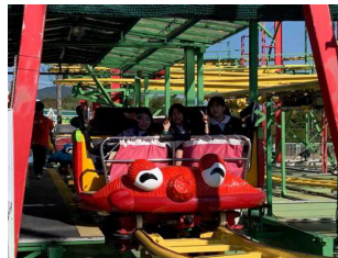
【グリーンランドにて】

友達と楽しく過ごす姿、歴史で学んだ文化遺産等 を見学する姿、公共のマナーを守る姿、安全に気を付 けた行動など、6年生の子供たちの姿に、6年間の成長 を見ることができた思い出いっぱいの最高の修学旅行 でした。