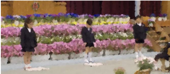
児童を代表して新2年生が、自分たちで描いた絵を使ってお祝いのご挨拶を発表しました。