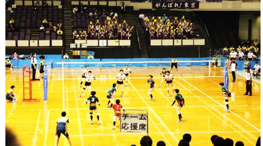
国体観戦（少年女子バレー）

気温や湿度の変化、日照時間の減少など、季節の変化に体が適応できずに、倦怠感や食欲不振、集中力の低下、イライラ感などの症状が起こるそうです。秋バテ予防には、バランスの良い食事を摂ることが重要とか。食欲の秋を楽しんで、秋バテにならないようにしましょう。