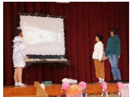
せごどん～タイムスリップの巻 (図書・広報委員会)

インフルエンザの流行が続いています。基本的な感染対策と抵抗力の強い体づくり（早寝・早起き・朝ご飯）が大切です。3学期の始業式（1月9日）を子供たちの「おはようございます」の元気な声と笑顔で迎えることができますように、よろしくお願いします。