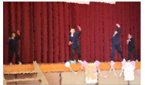
ツバメ・エビカニクス(1・2年)