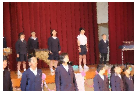
合奏・音楽劇（全校児童）