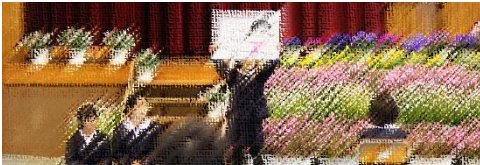
児童を代表して新2年生から新5年生の児童が、自分たちで描いた絵を使ってお祝いのことばを発表しました。