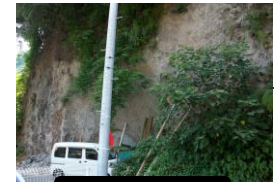
九州商船団地付近