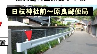
日枝神社前～原良郵便局