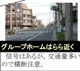
グループホームはらら近く