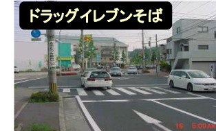
ドラッグイレブンそば