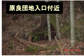
原良団地入口付近