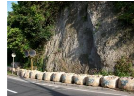
原良団地入口付近