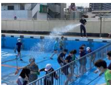
ずぶぬれになったプール掃除