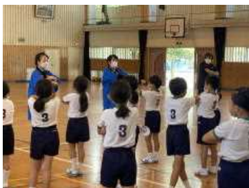
一生懸命頑張った地域の踊り