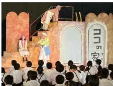
感動した芸術鑑賞