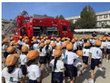
消防車にびっくりした避難訓練