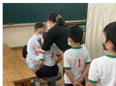
ドキドキした内科検診