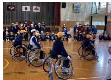
難しいけど楽しかった車いすバスケット体験