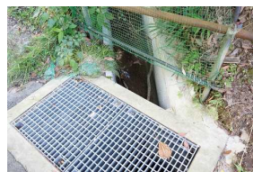
D さくら団地道路側溝1