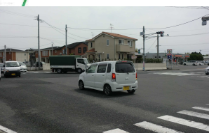
P お茶の里前交差点