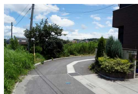
A 平和団地曲がり角