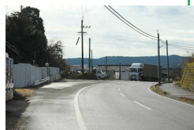
F 四元土砂処分場前