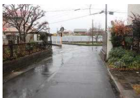
B 学校裏市道三叉路