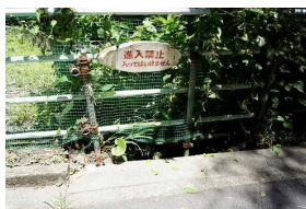
D さくら団地道路側溝2