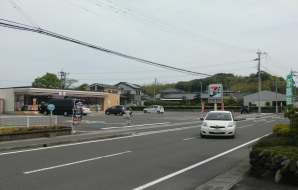
Q セブンイレブン駐車場