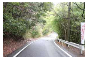
C・D 上伊集院団地～さくら団地