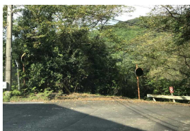
D さくら団地道路崖