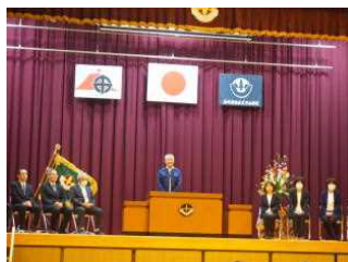
【最後のメッセージ】