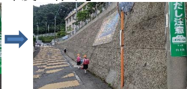
【苔を除去、きれいな通学路】