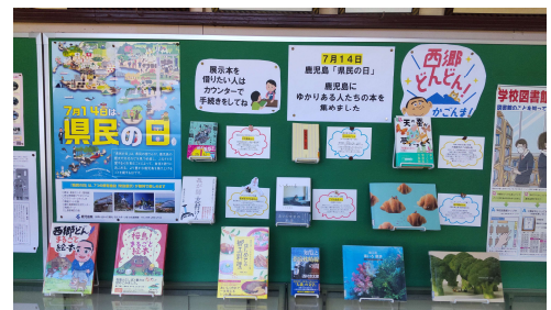
「郷土図書コーナー」

ご家庭でも南北600kmにわたる多様な風土をもつ本県の魅力について話題にしてほしいと思います。