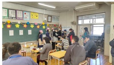
がったにマルシェ