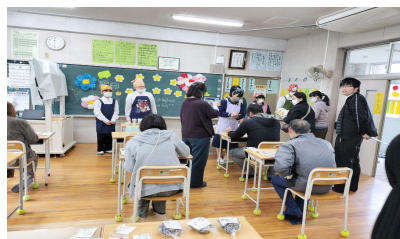
がったにマルシェ