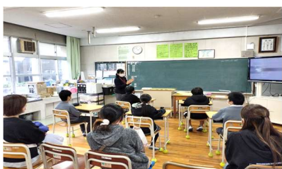
特別支援学級体験学習会

生徒の皆さんにはこの3学期を次年度の「0学期」と捉えてほしいと思っていますところですが、準備はどうでしょうか？残り一日一日を大切に、次年度への励みになるよう充実した学校生活になることを期待しています。