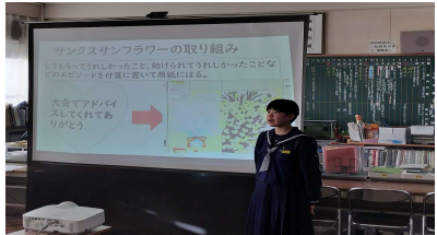
「いじめサミット」の発表