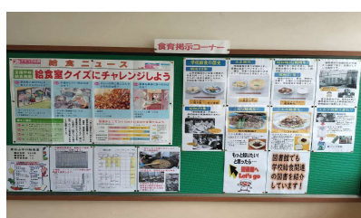
食育掲示コーナー