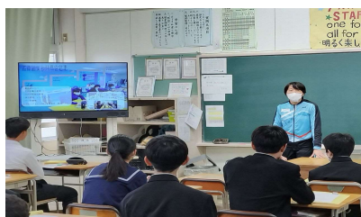
2年生「社会人に学ぶ」

さて、3学期は今年度のまとめと来年度への準備期間です。今年度の振り返りと同時に、来年度の「0学期」とであるという意識をもって学校生活を送ってほしいと思います。学校でも生徒の頑張りをしっかりと支えるために全職員でサポートに努めていきたいと思ひます。