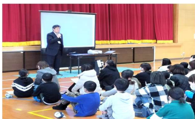
入学説明会の様子（校長あいさつ）

本校では新入生が意欲をもって元気に気持ちよく入学できるようにしっかりと準備をしていきたいと思っています。生徒の皆さんも後輩を迎える準備を始めましょう。