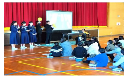
生徒会役員による説明