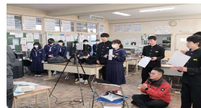
リモートによる全校朝会