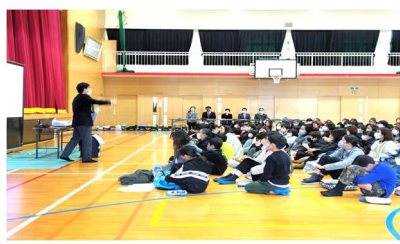
入学説明会の様子（生徒指導当から）