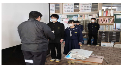
2年6組の表彰（春の祭典）

今週の全校朝会では各部等の表彰伝達、そして生徒会役員が「いじめサミット」の内容を全校生徒に向けて発表してくれました。