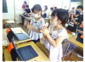
【2年 音楽科の研究授業】