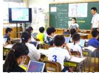
【5年 社会科の研究授業】