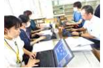
【職員研修での授業研究】

今年度の本校の職員研修は、『効果的なICT活用を通じた授業改善Ⅱ』をテーマとして取り組んでいるところです。9月25日は2・3・5年の学級で研究授業と授業研究を行いました。子供たちのじっくり考える姿や学び合う姿、生き生きと活動する姿がたくさん見られました。今後も子供たちに確かな力を身に付けていくためにICTを効果的に活用した授業改善に進めていきます。