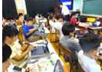
【3年 音楽科の研究授業】