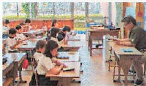
【教師・児童ともに読書活動】

今年度から、20分間の読書タイムに取り組んでいます。心静かに本と向き合う学級、教師の読み聞かせを行う学級など、発達段階に応じた取り組みを行っています。家庭でも読書タイムの設定いかがですか。心を豊かにする読書活動、お勧めします。