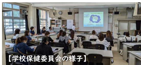
【学校保健委員会の様子】

学校保健委員会テーマ「寝る1時間前は、デジタル機器の電源OFF！」に取り組み、睡眠の質を高め、児童の健全な成長につなげていきましょう。