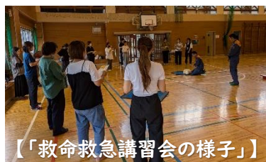
【「救命救命講習会の様子」】