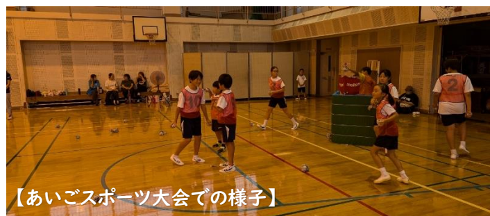
【あいごスポーツ大会での様子】

中学校へ進学する前に、他校児童との交流を図ることはとても意味があります。ぜひ、地域への行事に参加させてみてはいかがでしょうか。