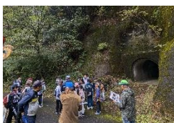
【神園農道トンネル前】