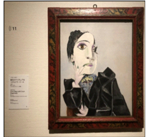
パブロ・ピカソ「緑色のマニキュアをつけたドラ・マール」1936年