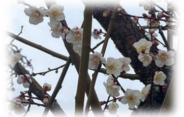
校庭の満開の梅の花

2024年（令和6年）新しい年を迎えました。皆様も、気持ちを新たに新年を迎えられたこととお喜び申し上げます。ただ、今年はニュース等でご存じのように1日、2日と心が痛くなる出来事が続きました。お亡くなりになられた方のご冥福を心よりお祈りいたします。