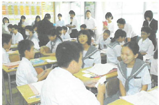
4組(英語「ウッド先生がやってきた」)