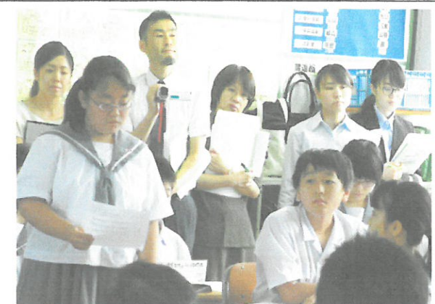
6組(総合的な学習の時間「課題の設定」)