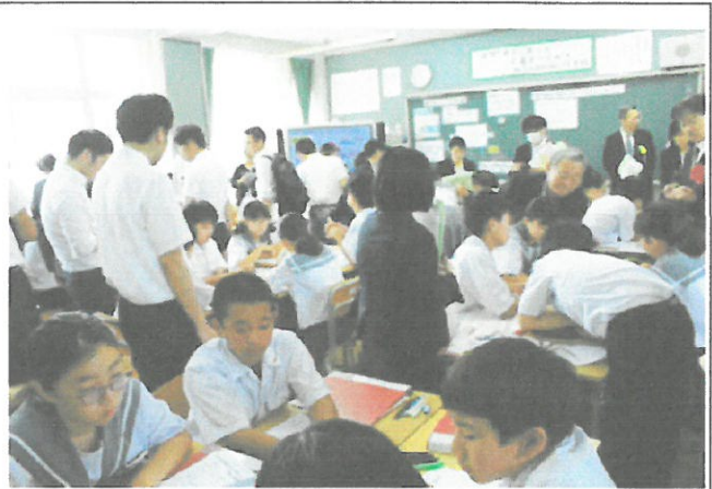
2組(総合的な学習の時間「整理・分析」)