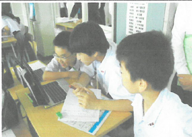
5組(総合的な学習の時間「情報の収集」)