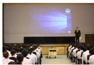
私立高等学校説明会(3年)

10月16・17日の二日間で、11校の私立高等学校の先生が来校され、説明会を行いました。三年生にとっては、卒業を半年後にひかえ、卒業後の進路としての受検(験)高校などを決定しなければならぬ時期となってきました。それぞれの私立高等学校の特色や学科の内容、進路先などの説明を真剣なまなざしで聞いていました。寒くなりつつありますので、体調管理に気を配って受検(験)に向けていきましよう!