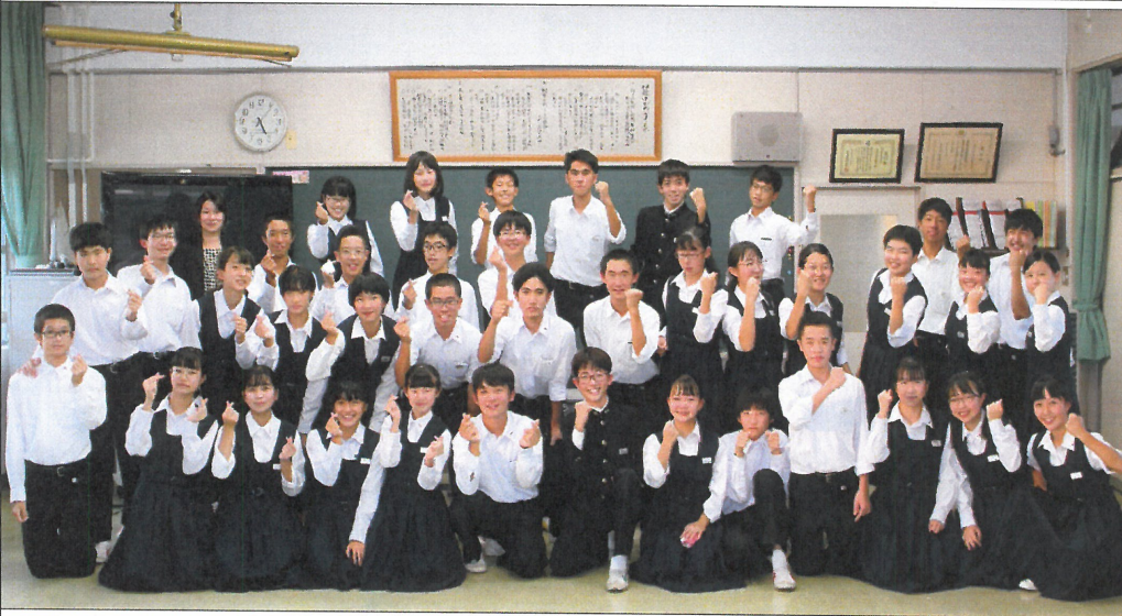
右上：生徒会旗を受け継ぐ会長・副会長 左上：功労賞を受け取る会長 下：第74・75代生徒会役員

り、生徒会活動を行ってきた第74代生徒会の三年生のみなさんに活動を終えた今の気持ちを述べてもらいました。