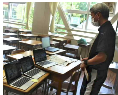
↑3クラス一斉に保健の授業を行うため、授業者の前には3クラス分の配信用タブレットが並びます。

リモート授業は、生徒の健康を守るための有効な手段です。しかし、リモート授業には、いくつかの課題があります。例えば、生徒の集中力が続かないことや、コミュニケーションが取りにくいことなどです。これらの課題を克服するためには、授業の内容を工夫し、生徒の興味を引くことが大切です。また、生徒の健康を守るためには、適切な消毒や換気を行うことが大切です。以上のように、生徒の健康と学習の両方を大切にすることが、この時期の授業の進め方です。