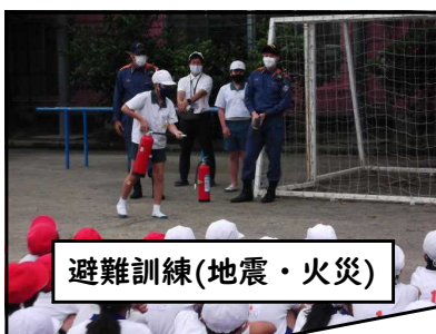
避難訓練(地震・火災)