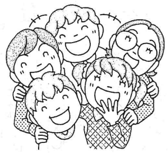
とも 友だちと仲よくできた