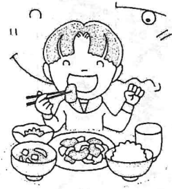
すおん た 好き嫌いせず何でも食べた