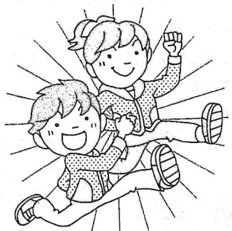
げんき 元気 元気に体を動かした