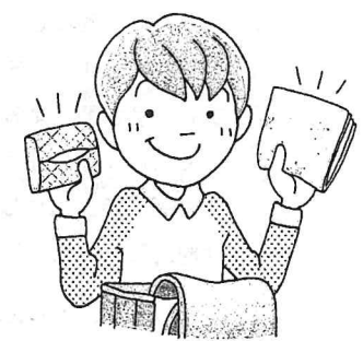
まいにち 毎日ハンカチ・ティッシュを持っていた