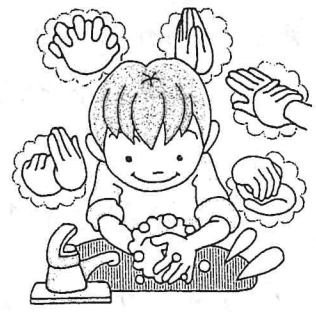
てあし 手洗いをがんばった