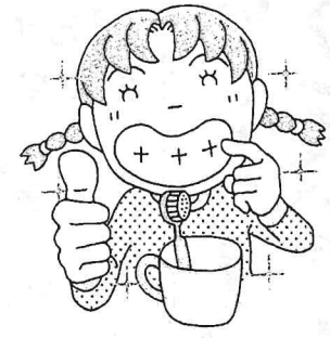
は 歯みがきをきちんとした