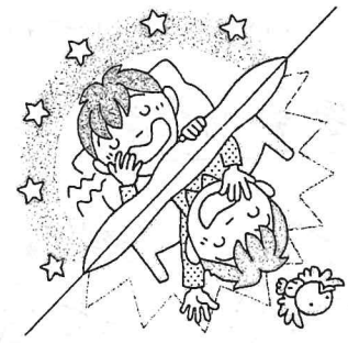
いねいお 早寝早起きができた