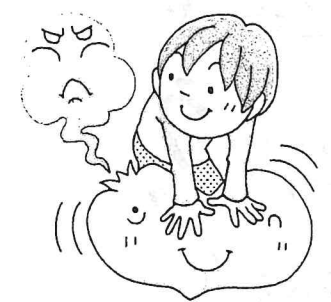
しょうず しょうず 스트레스を上手に解消できた