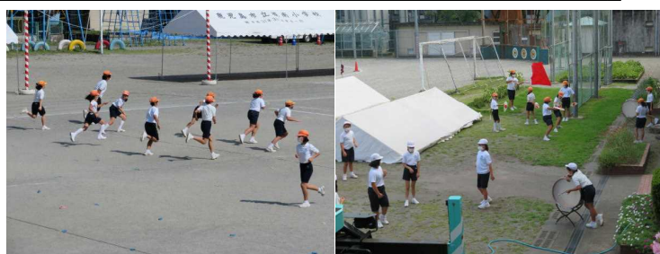
【リレーや応援団の練習の様子】

10月3日(日)は、いよいよ運動会です。本年度のスローガンは、『みんなの気持ちを一つにあつい勝負を!』です。今年もコロナウイルス感染拡大予防のため、規模を縮小して実施することになりました。練習についても、密を避けるために思うようにいかないこともあります。子供たちは、自分たちにできることを考え、精一杯がんばっています。制限の多い中での運動会開催となってしまいましたが、当日は子供たちの活躍を温かく見守っていただくとありがたいです。