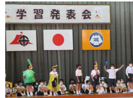
【2年 ゆめをかなえて2年生ドラえもん】