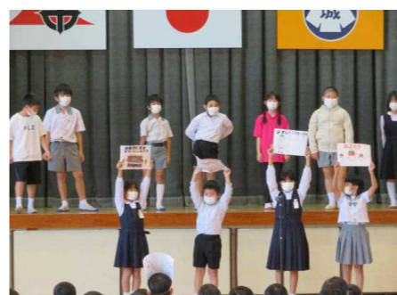
【4年 くじらぐもと都道府県の旅】