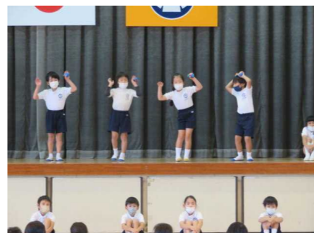
【1年 元気に音読あいうえお】

10月29日（金）に、これまで行ってきた学習活動の発表の場として学習発表会を行いました。これまでの学習を音読やボディパーカッション、劇などにして発表しました。どの学年も工夫をこらして元気いっぱい発表し、楽しい発表会となりました。