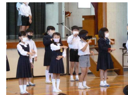
【3年 リレリ・ヨッシャヨッシャ・どっこいしょ】