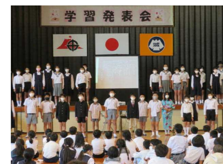
【6年 宮沢賢治の生き方】