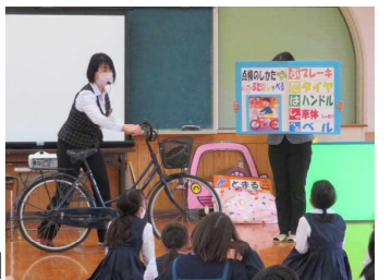
【交通安全教室の様子】

4月21日(木)2校時は4年生、3校時は1年生を対象に交通安全教室を実施しました。本年度もコロナ対策のため全学年での実施はできませんでしたが、(後日各学級で実施)4年生は、正しい自転車の乗り方を、1年生は、正しい横断のしかたを学習しました。交通ルールについてしっかり考える子供たちの姿が印象的でした。通学保護員・民生委員の方々をはじめ、地域全体で子どもたちをあたたく見守っていただいていることに、いつも感謝しております。