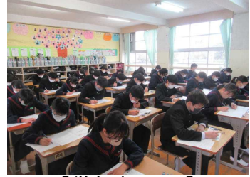
【学年末テスト】 義務教育最後の定期テストに真剣に取り組む3年生