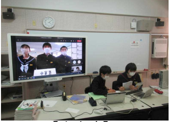
【中生連】 リモート開催となったブロック別中生連で同会を務める本校会長・副会長