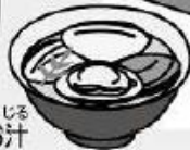
はまぐりのうしお汁

「ひな祭り」の名で親しまれ、桃の花やひな人形を飾り、女の子の健全な成長を祝います。行事食には、「ちらしずし」「はまぐりのうしお汁」「ひしもち」「ひなあられ」などがあります。