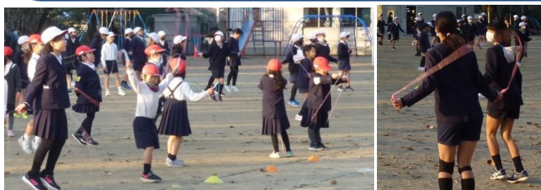
みんなで練習する姿(上)とリードする体育委員会(右)