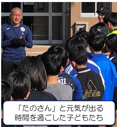
「たのさん」と元気になる時間を過ごした子どもたち