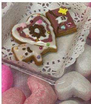
親子でチャレンジしたアイシングクッキー