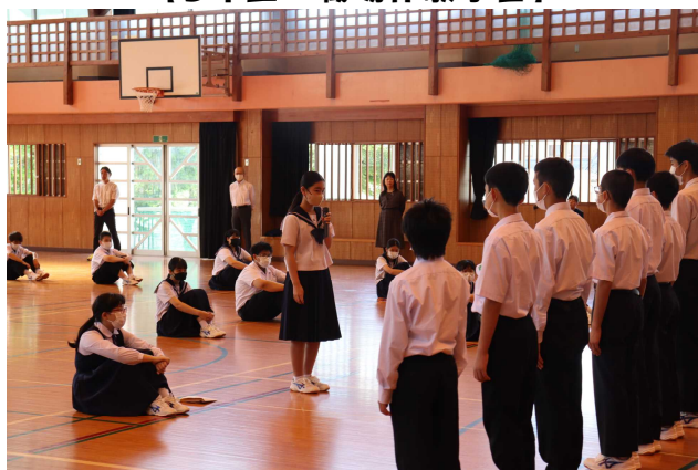
【市中体連総体 推戴式】

他にも、 人権教室 、 家庭教育学級開講式 、 生徒会総会 と毎週何かしらの行事がありました。6月も以下のようにいっぱいです。