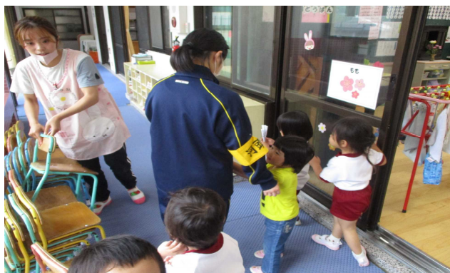
【3年生 職場体験学習】