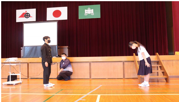
【生徒会 校内でのあいさつ作法の提案】

コロナ感染がひとまず収まり、学校生活も以前のリズムを取り戻しつつあります。今月も沢山の行事に頑張るコガ中生の様子をお送りいたします。