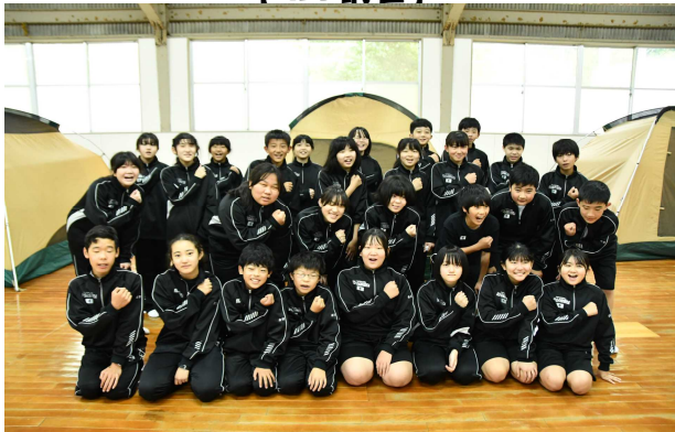
【1年生 集団宿泊学習】