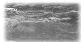
穏やかに流れる甲突川