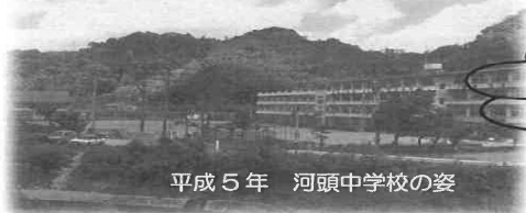
平成5年 河頭中学校の姿

学校長から保護者のみなさまへ御案内とお願いです。 当時のPTAの方が本校で「河頭8・6のつどい」を開催することになりました。当時の河頭中をよくご存じの方、8・6豪雨水害について詳しく知りたい方々参加は自由です。趣旨を御理解いただき、現在のPTA会員の方々にも積極的に参加いただきますようよろしくお願いいたします。 参加できる方は、中学校（238-2663）に事前に御連絡いただくとありがたいです。