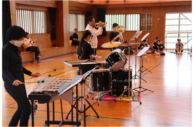
【吹奏学部の部活動紹介の様子】

その後の部活動オリエンテーションでは、新入部員の勧誘を目的に、各部、実技を交えた部活動紹介を行いました。キャプテンを中心に、それぞれ部の紹介と日頃の練習の様子を披露してくれました。たくさんの入部を期待しています。