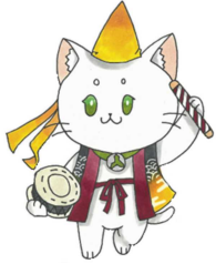
河頭中マスコット 「ゆめは」