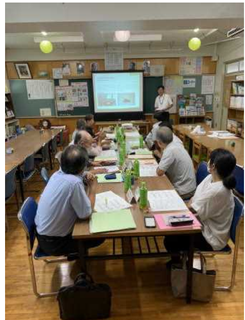
【学校運営協議会の様子】

委員の皆様からは、地域での夏休みの生徒の様子の話や様々なご意見がありました。熱心な協議、本当にありがとうございました。今後は学校便り等でもお伝えしたいと思いません。なお、第3回学校運営協議会は12月18日(水)開催予定です。