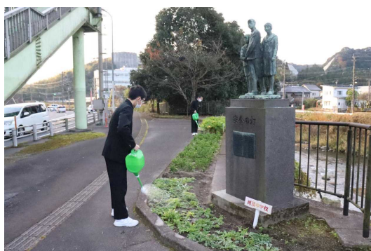
国道沿いの花壇の世話をする3年生

保護者、地域のみなさまにおかれましては、河頭中の教育活動に御理解・御協力を賜り、1年間大変お世話になりました。どうかよいお年をお迎えください。