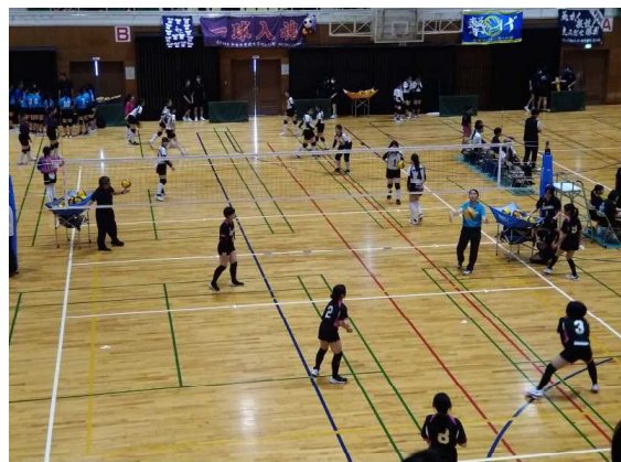
試合前の河頭中女子バレー部（手前）

6月10日～4日間、市郡中学校総合体育大会が開催され、各競技会場で熱戦が繰り広げられました。短い時間でしたが、私も各会場で本校の生徒が一生懸命に活躍する姿を見ることができました。特に3年生にとっては、最後の地区総体ということもあり、どの競技も意気込みを十分に感じました。試合が終わった後、これまで、顧問・コーチの指導の下、仲間と共に目標をもって頑張ってきたことや十分に力を出し切れなかった悔しさなど様々な思いが走馬灯のように頭の中をよぎったに違いありません。これまでの自分の努力を知っているのは、自分自身。この貴重な経験は、これまでの日々の練習を休まずに成し遂げた者にしか得ることができない価値あるものだと思います。部活動を頑張り続けてこれた自分を誇りに、これまで指導・支援して下さった方々に感謝し、自信をもって次の目標に向けて気持ちを切り替えてほしいと思います。