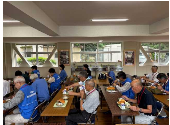
給食試食会の様子(パン・チキン・ポテトチャウダー)

6月24日(火)校区の児童・民生委員21名が来校され、授業参観と給食試食会がありました。授業参観は主に武道館で1年生の棒踊りの練習を見学しました。1年生は現在、7月11日(金)に開催する郷土学習発表会に向けて、地域の方を講師に招いての踊りの練習を一生懸命頑張っています。その後の給食試食会では、みなさん全て完食され、男子ソフトテニス部の県大会出場を大変喜んでいらっし