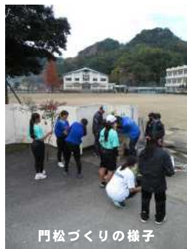
門松づくりの様子

令和8年度は、1年生1学級、2年生1学級、3年生1学級、特別支援学級2学級で5学級の予定です。生徒の増減により、学級数が変わる場合がありますので、今後、家庭の事情等によりお子さまが本校を転出する可能性が生じた場合は、速やかに学校にお知らせくださいますようお願いいたします。