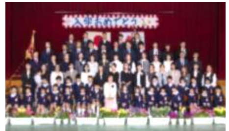
11名の新しいスタッフを迎え、郡山小の子どもたちのために頑張ります!!

51名の新1年生が入学しました。今年度は2クラスになりました。体育館で6年生のお兄さん、お姉さんがつくるアーチに迎えられての入学式。はじめは緊張した様子でしたが、すぐに落ち着き、しっかりとした態度で話を聞くことができました。また、新入生呼名では、大きな返事としっかりとした礼をすることができ、かわいくもあり、たくましくも見えました。小学校生活も約1か月が過ぎました。学校生活にも慣れ、勉強や運動を楽しみながらがんばっています。しかしながら、まだまだ不安なことも多いようです。引き続き、励ましをお願い致します。