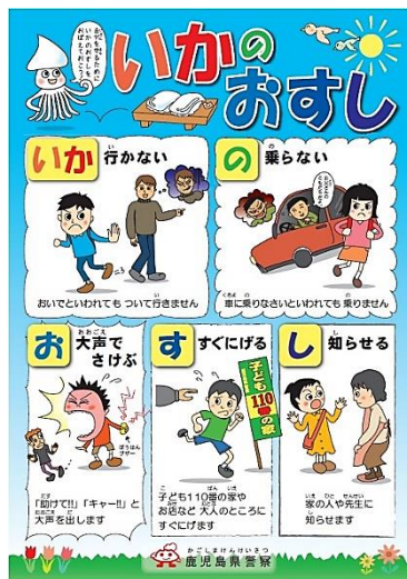
鹿児島県警察 あんしん通信より

またゴールデンウィークが参ります。交通安全にも十分注意して、楽しくお過ごしください。