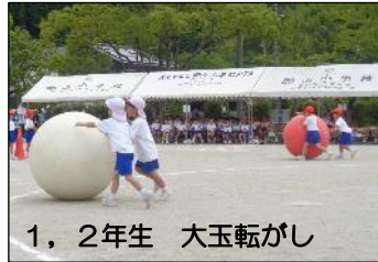
1, 2年生 大玉転がし