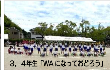
3, 4年生「WAになっておどろう」