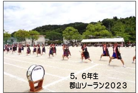
5, 6年生 郡山ソーラン2023