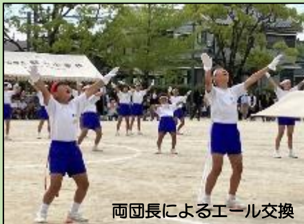
両団長によるエール交換