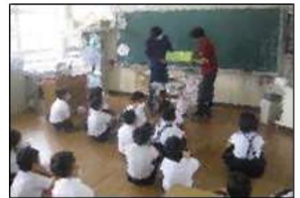
6月22日 読み聞かせの様子

このほか、語彙力・文章力・理解力が高まることもわかっています。子どもたちが多くの素晴らしい本と出会いながら、成長につながればよいと思います。