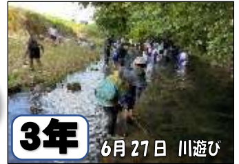
3年 6月27日 川遊び

この日は30℃を超える暑さとなり、水の冷たさがとても気持ち良かったです。事前に除草をして頂き、見守りのお手伝も頂きました。ボランティアの方、ありがとうございました。