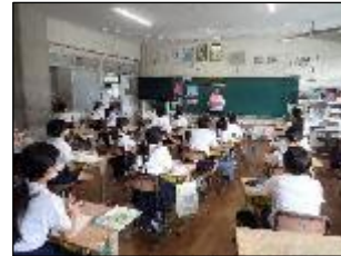
職員研修 グループ協議