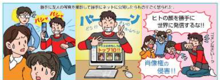
＜文部科学省委託事業 ここからはじめる情報モラル指導者研修ハンドブックより＞

不特定多数に写真を送信することも肖像権の侵害になり得ます。特にネット上に一度公開された写真は、「半永久的に」世界のどこかで保存されていますし、削除はほぼ不可能です。自分や家族、子どもさんの映像が、今だけでなく、10年、または50年と公開され続けるリスクと責任も知っておきましょう。(郡山小でもこれまで以上に画像等の取り扱いは気をつけて参ります。)