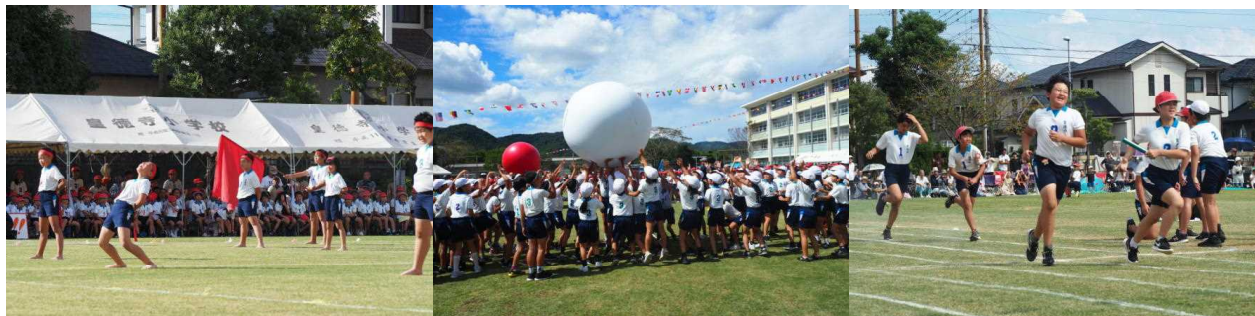
【応援団によるエール交換】

前日及び当日早朝の場所取り等、保護者の皆様の御協力に感謝いたします。また、御来賓の皆様・地域の皆様に御礼申し上げます。今年度の反省を基に、次年度の「創立30周年第30回運動会」が充実したものになるように努めて参ります。